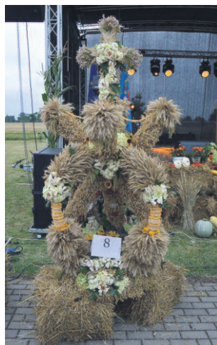
Wieniec z Cetynia