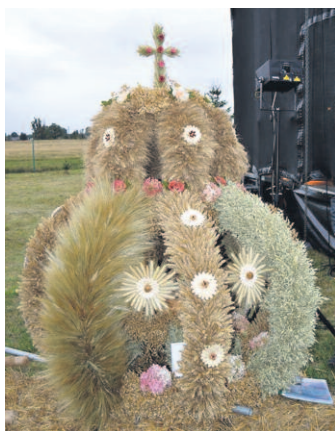
Wieniec z Poborowa

Tradycyjnie podczas uroczystości wręczono nagrody w konkursie na „Najpiękniejszy wieniec dożynkowy 2019” w którym zwyciężyło sołectwo Poborowo (bon o wartości 800 zł), drugie miejsce zajęło sołectwo Cetyń (bon o wartości 500 zł), trzecie – sołectwo Starkowo (bon o wartości 300 zł). Pozostałe sołectwa: Miszewo, Objezierze, Suchorze, Zielin, Trzebielino i Dolno otrzymały bony o wartości 200 zł.