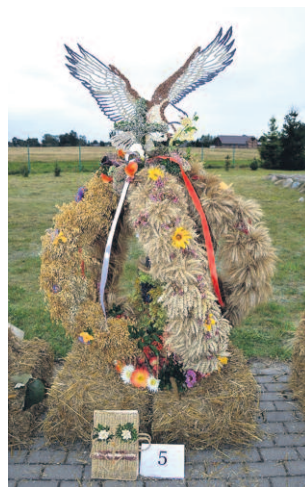
Wieniec ze Starkowa