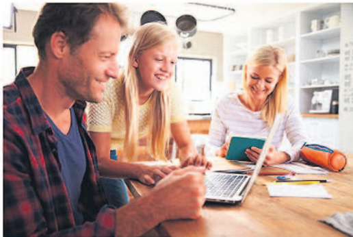
Szybki internet w domu

Celem inwestycji jest likwidacja internetowych „białych plam” na mapie Polski i dostarczenie ultraszybkiego i stabilnego internetu mieszkańcom oraz zmniejszenie technologicznego dystansu w stosunku do lepiej rozwiniętych cyfrowo regionów kraju. Realizacja inwestycji została podzielona na dwa etapy.